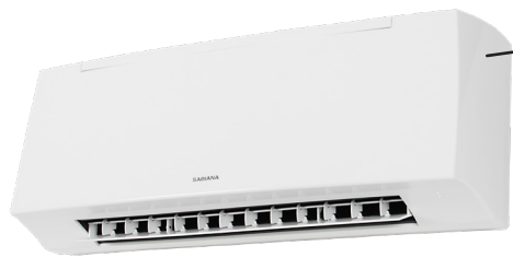
Carisma Fly Highwall-modell, monteras högt på väggen