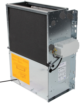
Carisma CRC-IO Dolt montage, i taket eller bakom väggen. Du kan även välja en fläktkonvektor ur Carisma CRSL-serien när du vill ha en väl dold placering av konvektorn.