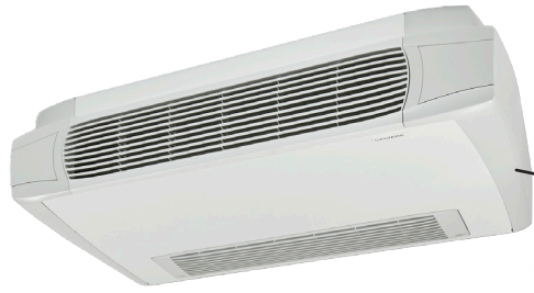
Carisma CRC-MO Synligt montage, som här i taket, eller på väggen.

Detta är exempel på fläktkonvektorer vi har i vårt sortiment som du kan använda vid frikyla.