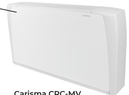
Carisma CRC-MV Synligt montage, på väggen eller i taket. Hos oss hittar du fler fläktkonvektorer som passar att montera synligt på väggen samtidigt som de fungerar bra för frikyla, t.ex. Carisma Whisper.